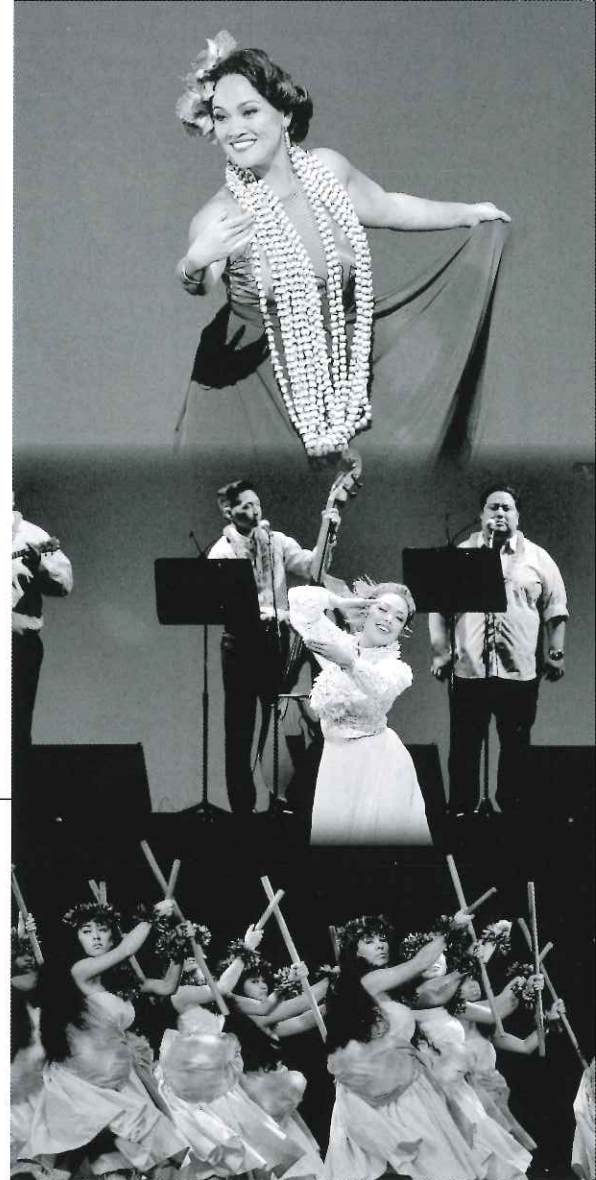
※写真は前回公演を撮影したもので、今年の出演者のものではありません。6月頃に今年の出演者を発表する予定です。

総勢百数十名の来日者による、名実ともにトップクラスの出演者が繰り広げる“フラ”と“ハワイアンミュージック”の華麗なる競演を、日本最大・最高峰のフラの祭典『ナ・ヒヴァ』で是非ご覧ください。