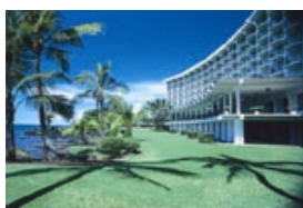
ヒロハワイアンホテル

* 日程表記載のスケジュールは2017年6月22日を基準に作成されています。 便名や時間、行程の順序などが変更になることがあります。