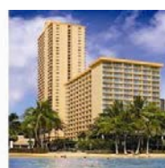
パシフィックビーチホテル