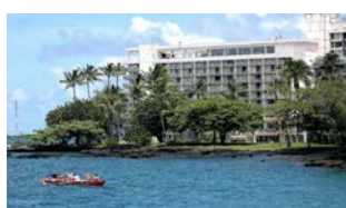
グランド ナニオア ホテル