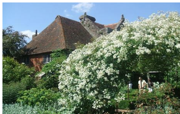
<ホワイトガーデン「シシングハースト」>