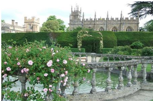
<優美さを誇る「スードリー城」庭園>