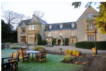
<アフタヌーンティーをいただく 貴族の館 ローズ・オブ・マナー>