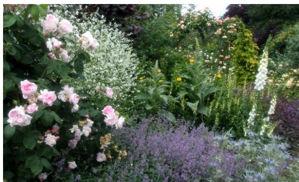
<バラの迷宮「コートン・コート」>