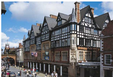
<チェスター/ロウズ> ロウズと呼ばれる木組みの美しいアーケードです。