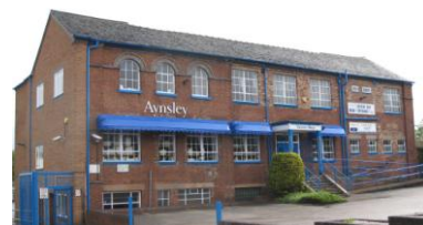
<ストーク・オン・トレント エインズレイ社>