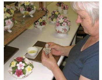
<エインズレイ社の工場での作業風景>